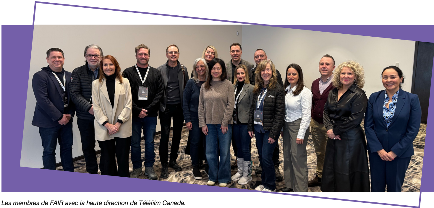
Les membres de FAIR avec la haute direction de Téléfilm Canada.