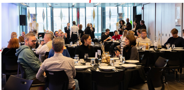
Session Pro de la SARTEC à l'ITHQ.