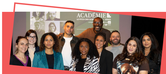
Cohorte 2024 du Pitch des scénaristes – Série.