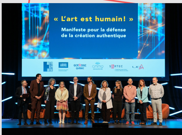
Les représentants des associations lors du symposium Face à l'IA.